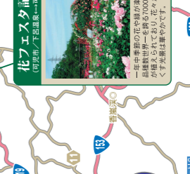
花フェスタ記念公園 (岐阜県下呂市/下呂温泉→花フェスタ記念公園(約90分))