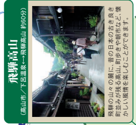
飛騨高山 高山市/下呂温泉→飛騨高山(約90分)