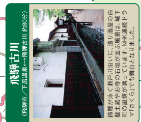
飛騨古川 (飛騨市/下呂温泉→飛騨古川(約80分))