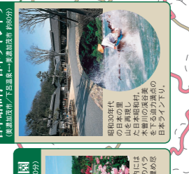
日本昭和村・日本ライン(下) (岐阜県下呂市/下呂温泉→日本昭和村(約90分))