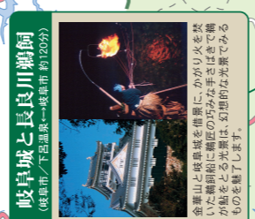
岐草城と長川神社 (岐草市/下呂温泉→岐草市(約100分))