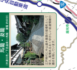
馬籠・妻籠 (中津川市/下呂温泉→馬籠・妻籠(約90分))