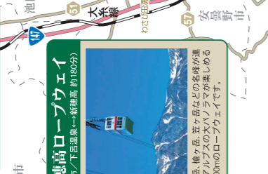
新穂高ロープウェイ (富山市/下呂温泉→新穂高(約180分))