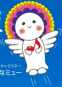
公式キャラクター はなミュ